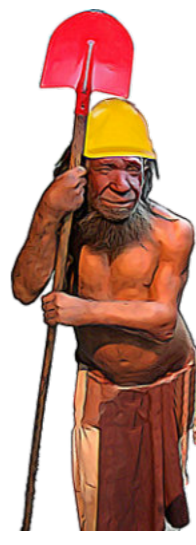
Alle Angaben ohne Gewähr